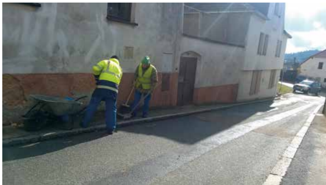
Pravidelný úklid města se provádí nejen technikou

Ano, v současné době se snažíme využít všech dotačních titulů vypsaných na vylepšení odpadového hospodářství a techniky k tomu potřebné. Pracujeme na rozšíření objektu sběrného dvora a na nákupu nového vozidla namísto staré Avie. Tyto dotační tituly se snažíme využít ne jenom jako město, ale