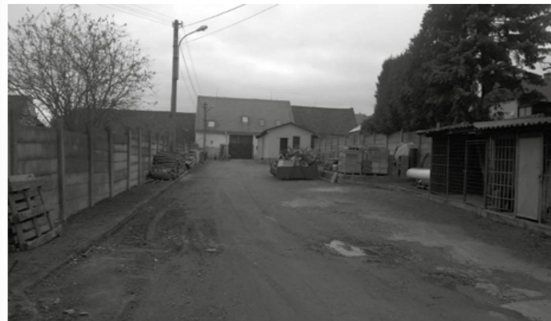
Bývalý areál firmy Hataj&Chouň