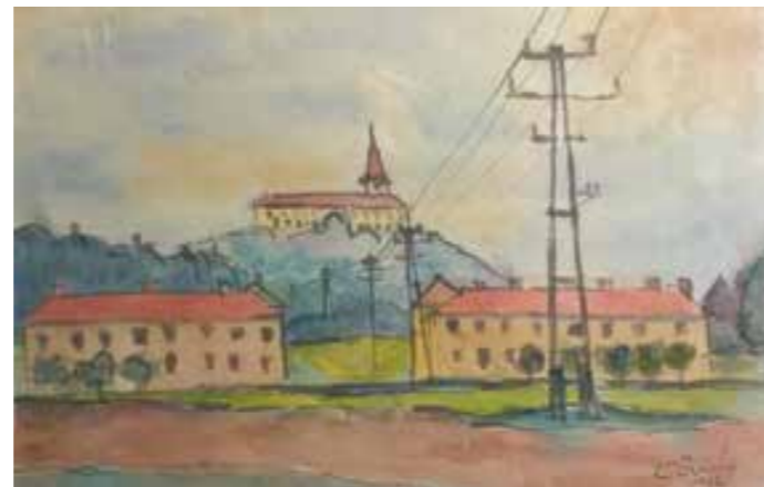
Kresba Ladislava Čáslavského z roku 1962