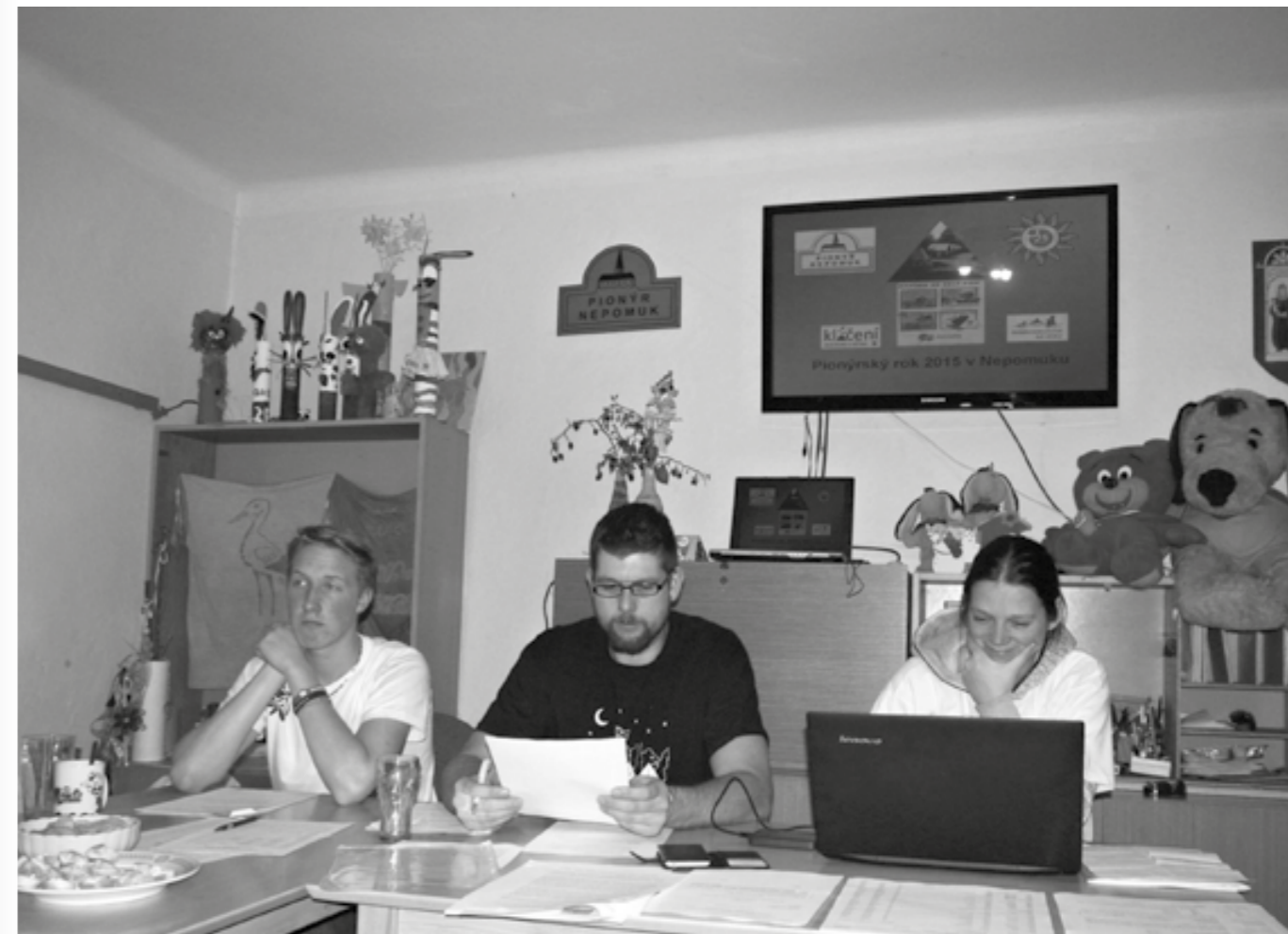
Jednání Rady pionýrské skupiny

Zástupci Pionýrské skupiny v Nepomuku se sešli 22. 1. 2016 na výročním jednání Rady PS a hodnotili uplynulý rok 2015. Tento rok byl pro pionýry významný tím, že byl rokem 25. výročí obnovení Pionýra a celá činnost organizace byla zaměřena na akce „25 let vlastní cestou.“ A jak se nám to všechno dařilo? Ve skupině máme 200 členů, z toho 75 dětí do 15 let. Celoročně se schází každý týden čtyři oddíly dětí a sedm oddílů mládeže se schází nejméně jednou měsíčně o víkend. Připravili jsme 89 akcí, kterých se zúčastnilo 3190 účastníků. Jsou to různé soutěže, turnaje, vycházky, výstavy, výlety, nocování pod širákem. Rádi na nich vždy přivítáme i ostatní děti a mládež z okolí. Mezi ty nejzajímavější patřily karneval s Pusíkem, turnaj hvězd ve volejbalu, čarodějnický rej, výstava k 25. výročí Pionýra, škraboškový pionýrský bál, čertovský večer Nebe a peklo, vánoční turnaj ve stolním