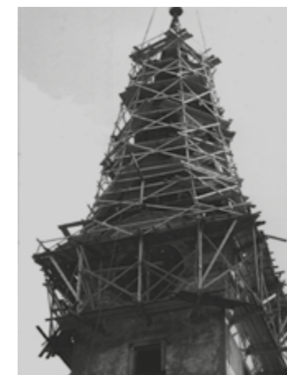
Oprava věže zámku v roce 1965

Ze společenských organizací pracují současně v obci: Čsl. červený kříž, Dobrovolná sportovní organizace Sokol (v části nepomucké) a Slavoj (v části dvorecké), Čsl. svaz požární ochrany, Svazarm, Svaz protifašistických bojovníků, Svaz čsl. sovětského přátelství, Čsl. svaz invalidů, Spolek přátel žehu, Svaz chovatelů drobného domácího zvířectva, Čsl. svaz ovocnářů a zahrádkářů, Čsl. svaz rybářů, Čsl. svaz včelařů, Lidové myslivecké sdružení, dohlížecí výbor Jednoty, lid. Spotřebního družstva Plzeň-jih, kteréžto družstvo obstarává na Nepomucku distribuci. Při školách pracují sdružení rodičů a přátel školy.