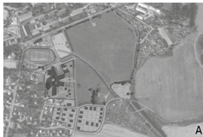
Skica varianty A. Všechny varianty najdete na www.nepomuk.cz/cs/zpravy

Plánovací akce byla uskutečněna ve spolupráci s Centrem pro komunitní práci západní Čechy v rámci projektu KOMPAS – podpořeného grantem z Islandu, Lichtenštejnska a Norska v rámci EHP fondů.