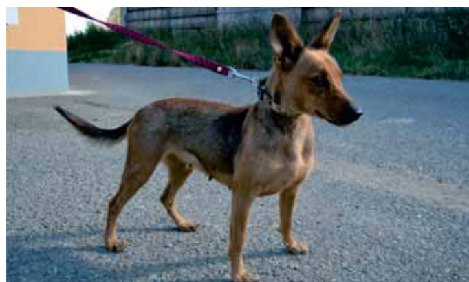
Mili je mladá fenka, kříženec, menšího vzrůstu. K neznámým lidem lehce odměřená, ale po získání důvěry je to nejmilejší a něžné psí stvoření.