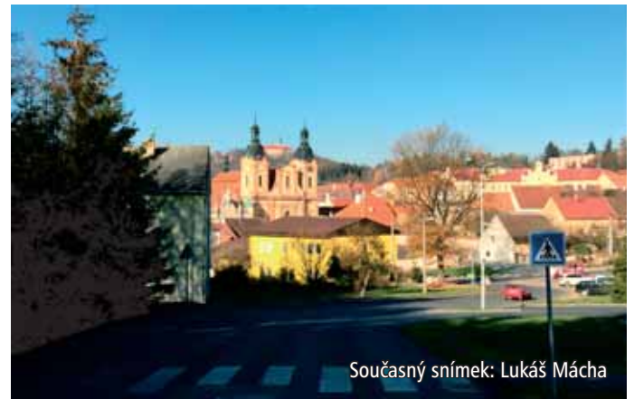
Současný snímek: Lukáš Mácha