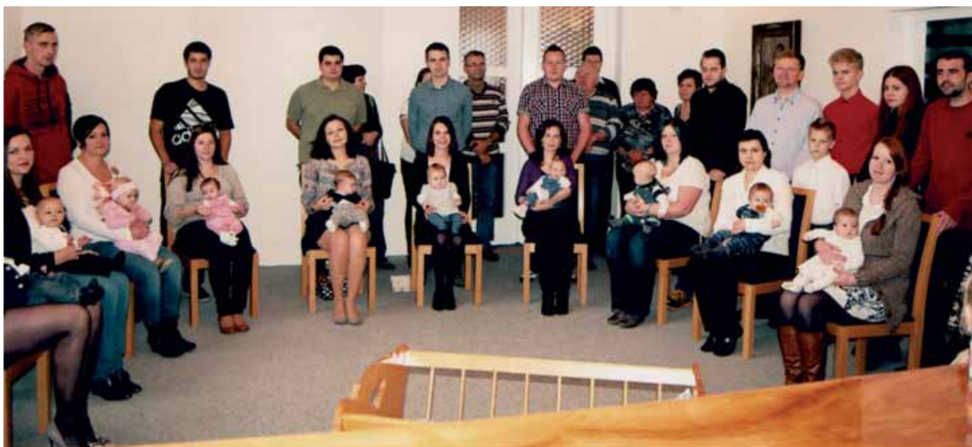
MŮ NEPOMUK - VÍTÁNÍ OBČÁNKŮ - 7.11.2015