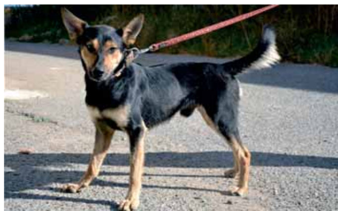
Pepa je kříženec německého ovčáka. Je to nadaný mladý pes, který visí očima na svém člověku a snaží se udělat „co mu na očích vidí“. Je to pes, který svého člověka nikdy nezklame, milý, ochotný a pracovitý.