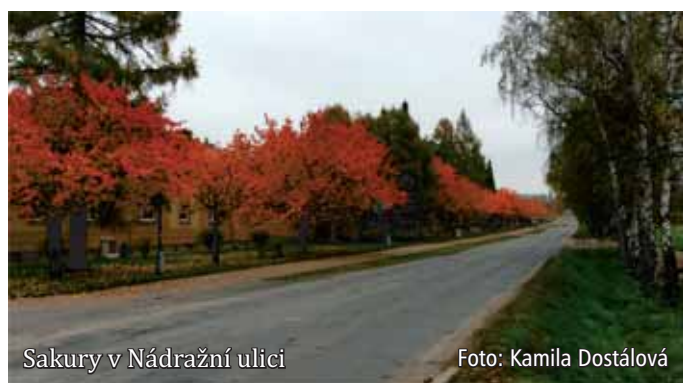
Sakury v Nádražní ulici