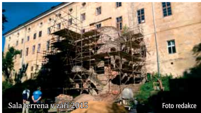
Sala terrena v září 2015

Postupně terasa zpustla a začátkem roku 2015 se jednalo o nejohroženější část zámeckého areálu. Díky bohatě dochované historické fotodokumentaci z Rodinných alb Auerspergů (SOA Plzeň, Klášter u Nepomuku), může být terasa obnovena do původního vzhledu včetně detailů, jakými jsou například nedochované prvky zábradlí.