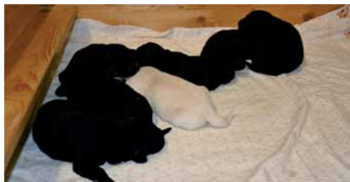
Tato krásná štěňátka budou k odběru v druhé polovině prosince. Maminka je hezký a milý kříženec německého ovčáka a tatínek labrador. K dispozici jsou 2 pejsci a 5 fenek.