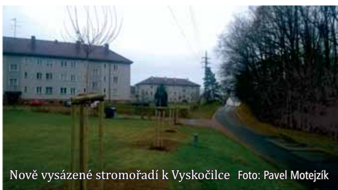
Nově vysázené stromořadí k Vyskočilce