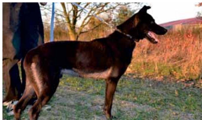
Shadow je mladý krásný kříženec německého ovčáka a pravděpodobně labradora. Je to pes, který se rád učí a pracuje. Je temperamentní, přesto vyrovnané povahy a milující lidi. Hodí se k aktivním lidem, kteří se mu budou věnovat, a Shadow jim veškerou péči bude s radostí oplácet.