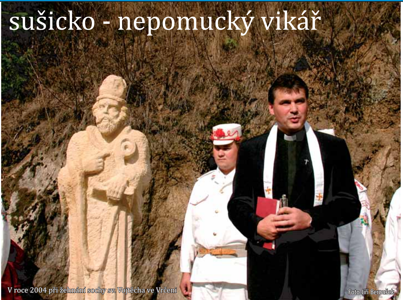
V roce 2004 při žehnání sochy sv. Vojtěcha ve Vrčeni