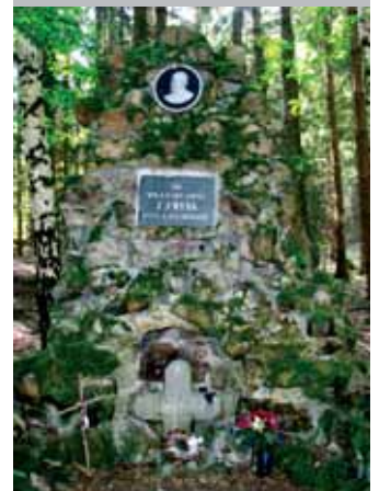
Mohyla na místě Rybova skonu