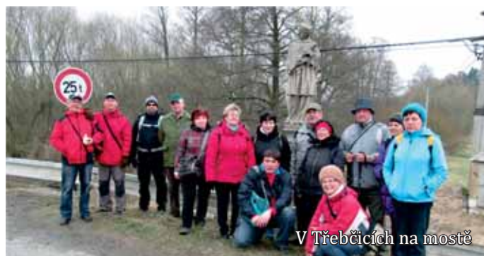
V Třebčicích na mostě