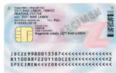
Zadní strana (s čipem)