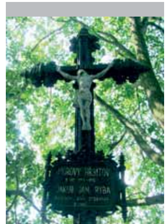
Kříž na původním místě Rybova posledního odpočinku