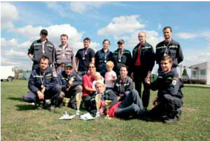
Nepomuk je nejlepší na okrese Plzeň-jih