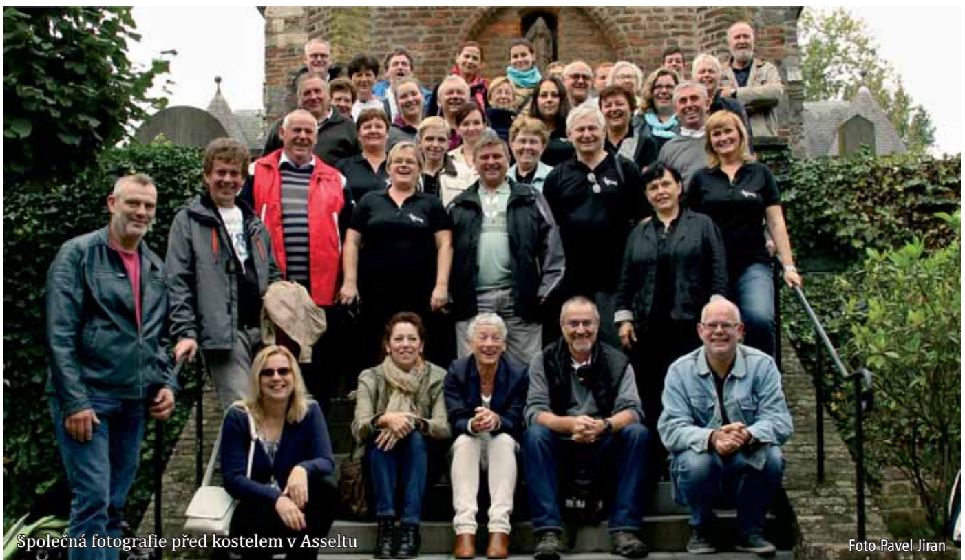
Společná fotografie před kostelem v Asseltu