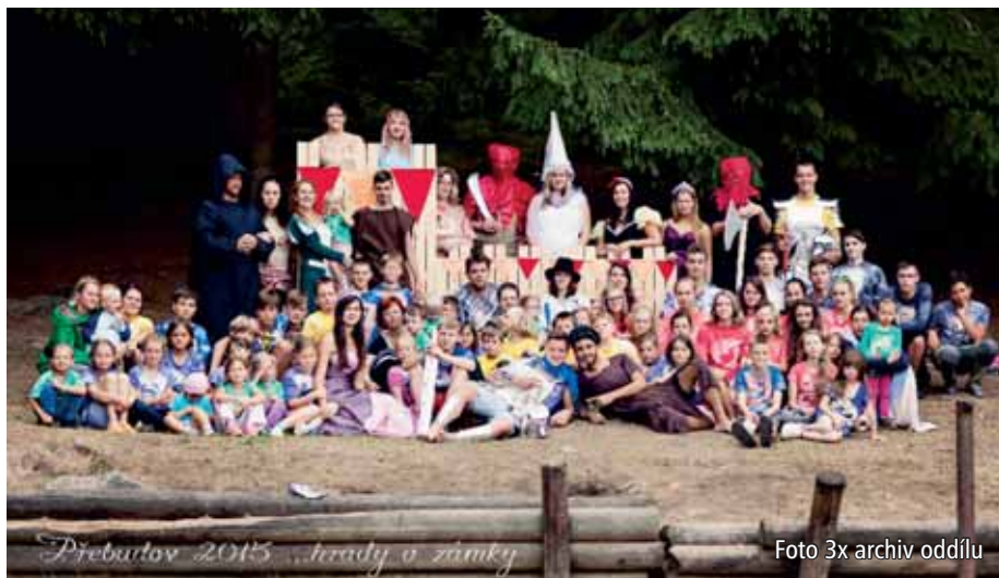
Přebudov 2015 ...hrady a zámky

Během teplých letních večerů jsme měli příležitost užít si některé noční hry, či pobavit děti diskotékou. Na náš tábor přijelo i několik návštěv, které dokázaly pobavit i poučit. Z těch zajímavějších to