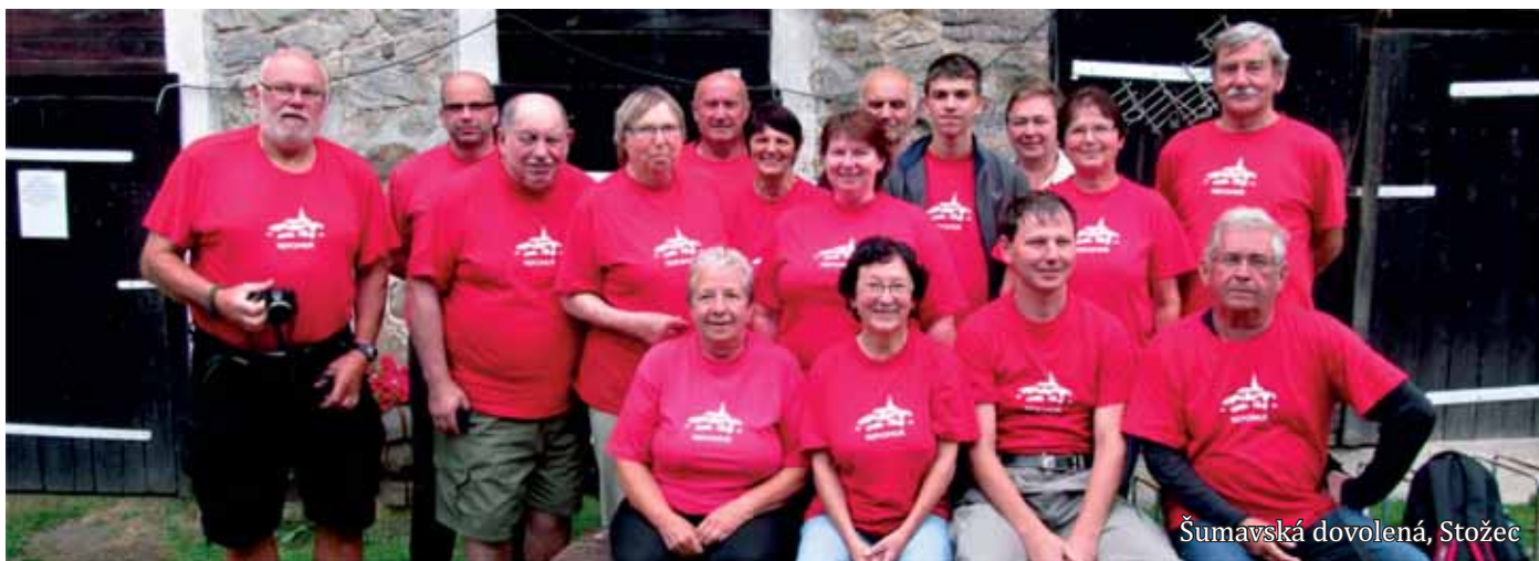
Šumavská dovolená, Stožec