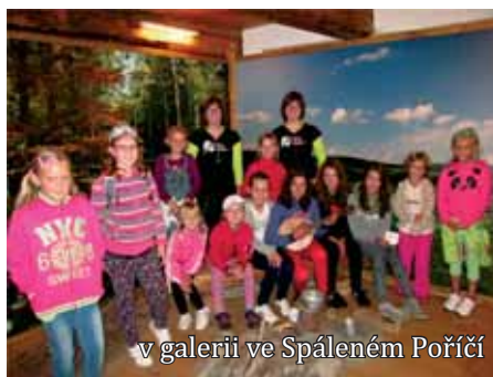
v galerii ve Spáleném Poříčí