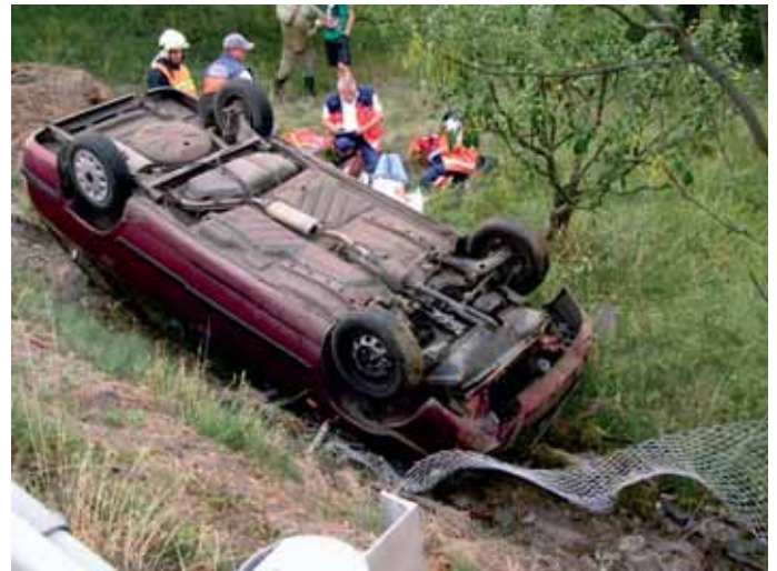
2. září dopravní nehoda osobního automobilu v Měcholupech