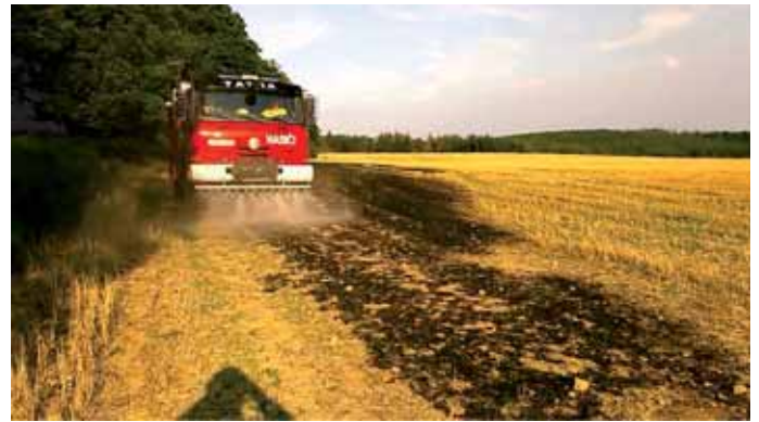
Dne 23. srpna požár posekaného pole za obcí Měcholupy