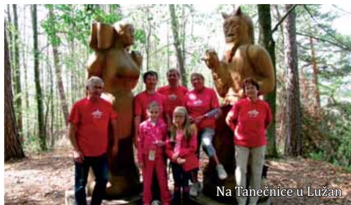
Na Tanečnice u Lužan