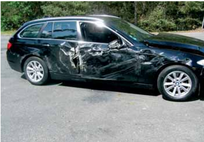
25. srpna dopravní nehoda na křižovatce u Třebčic