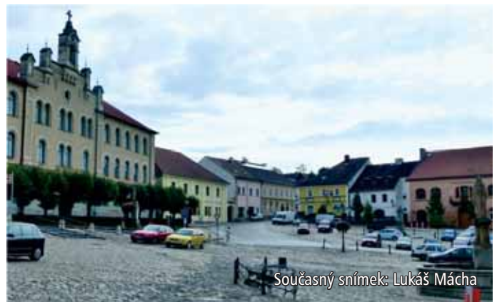
Současný snímek: Lukáš Mácha