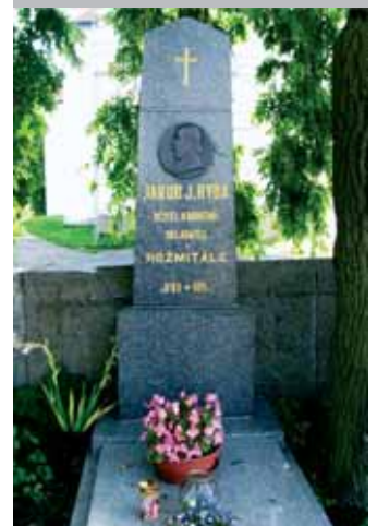
Rybův hrob ve Starém Rožmitále