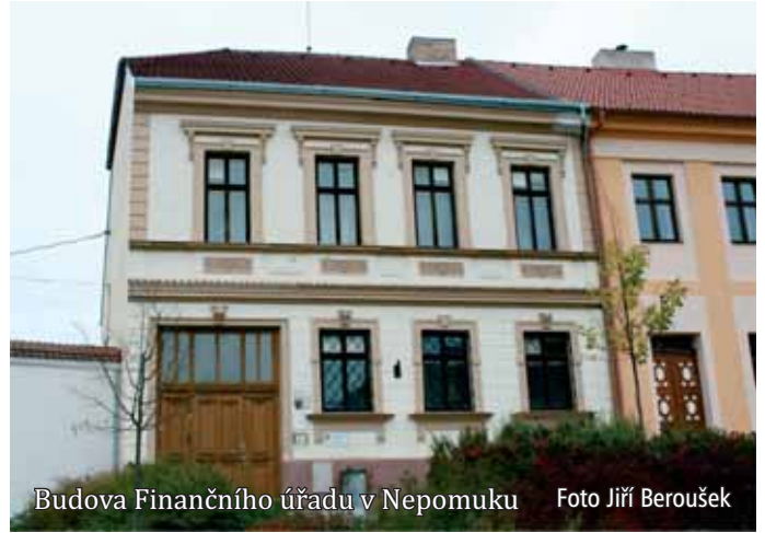
Budova Finančního úřadu v Nepomuku

Za rok pak dojde ke zhodnocení, zda systém na malých pobočkách funguje. Starostové malých obcí se nadále obávají, zda budou moci lidé opravdu komfortně vyřídit na