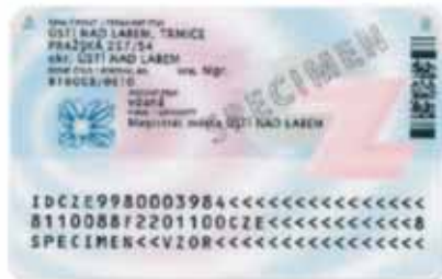
Zadní strana (bez čipu)