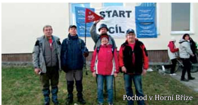
Pochod v Horní Bříze