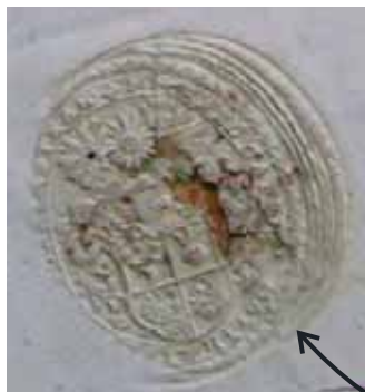
Detail otisku pečetidla