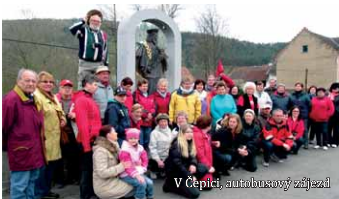
V Čepici, autobusový zájezd