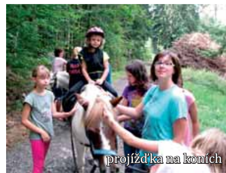
projížďka na koních

Pionýrská skupina v Nepomuku připravila zejména pro děti z oddílu Pusík příměstský tábor v týdnu od 17. do 21. 8. 2015 na naší klubovně. Tábor se zúčastnilo 14 děvčat a zajišťovali ho čtyři vedoucí oddílu. Dopolední program byl zaměřen na výtvarnou činnost a odpolední na turistické výpravy za poznáním. Hned pondělní dopoledne jsme se vrhli na naše tvoření s plnou vervou. Děti vyrobily čtyři nádherné výrobky a za celý týden jsme jich