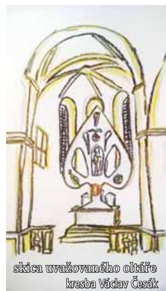
skica uvažovaného oltáře kresba Václav Česák