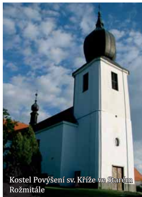
Kostel Povýšení sv. Kříže ve Starém Rožmitále