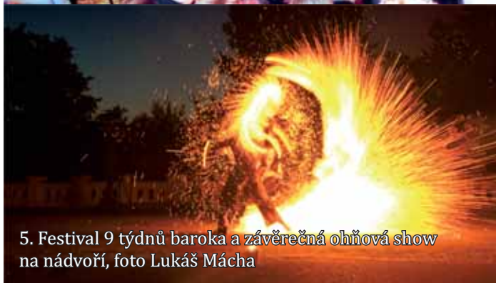
5. Festival 9 týdnů baroka a závěrečná ohňová show na nádvoří