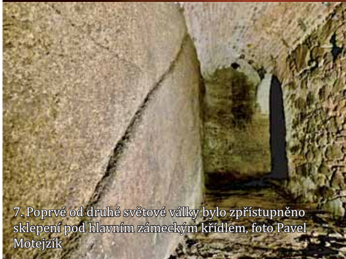
7. Poprvé od druhé světové války bylo zpřístupněno sklepení pod hlavním zámeckým křídlem, foto Pavel Motejzík