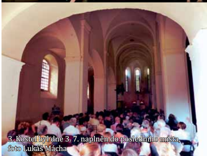
3. Kostel byl dne 3. 7. naplněn do posledního místa