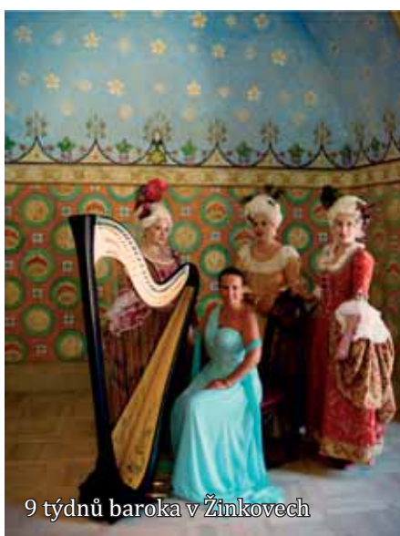
9 týdnů baroka v Žinkovech