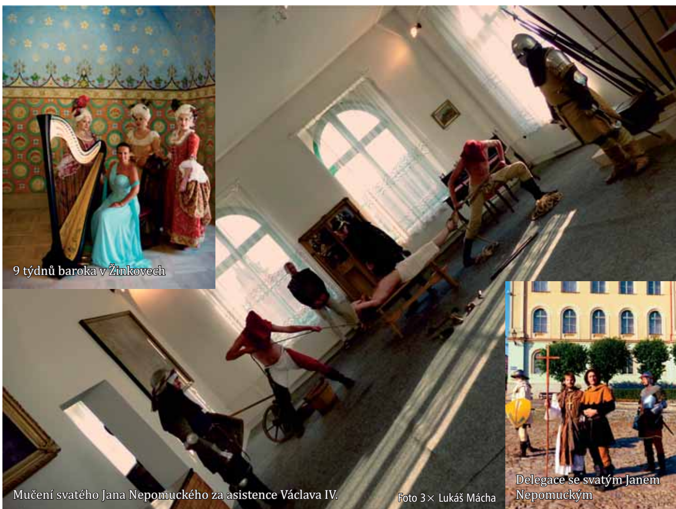
Mučení svatého Jana Nepomuckého za asistence Václava IV.