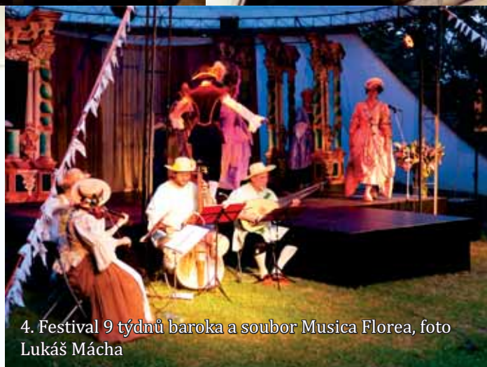
4. Festival 9 týdnů baroka a soubor Musica Florea