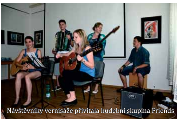
Návštěvníky vernisáže přivítala hudební skupina Friends