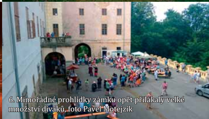
6. Mimořádné prohlídky zámku opět přilákaly velké množství diváků