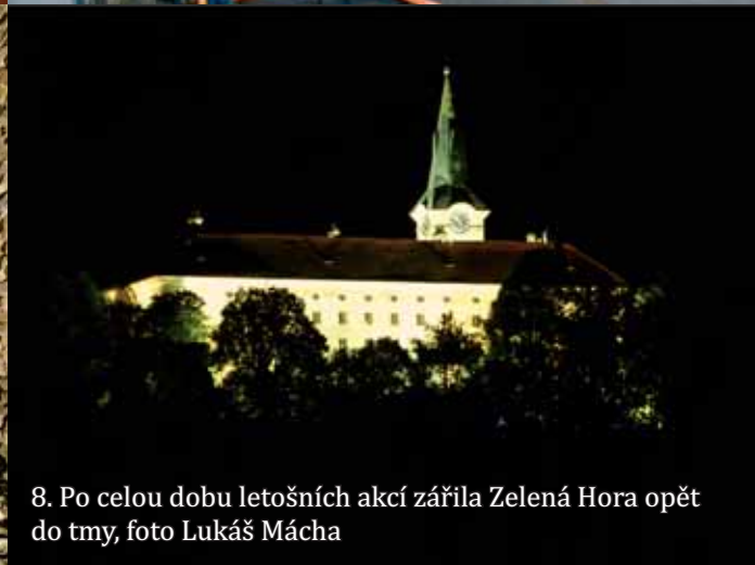
8. Po celou dobu letošních akcí zářila Zelená Hora opět do tmy