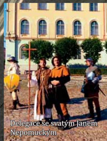
Delegace se svatým Janem Nepomuckým