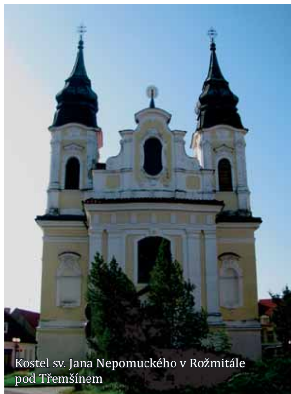
Kostel sv. Jana Nepomuckého v Rožmitále pod Třemšínem