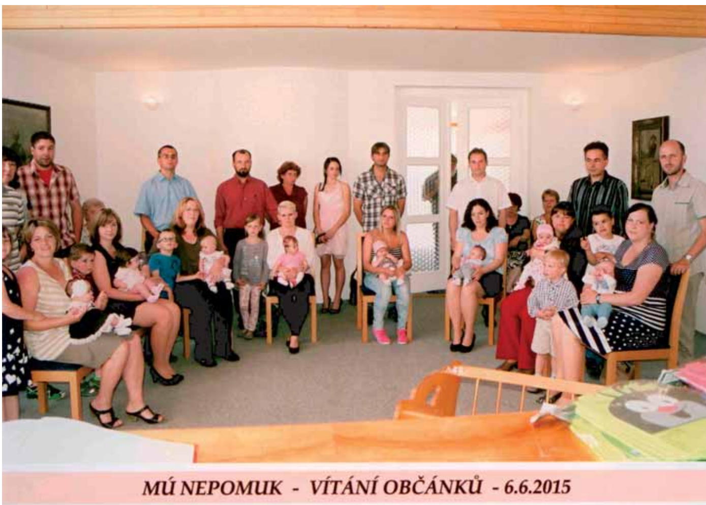
MÚ NEPOMUK - VÍTÁNÍ OBCÁNKŮ - 6.6.2015