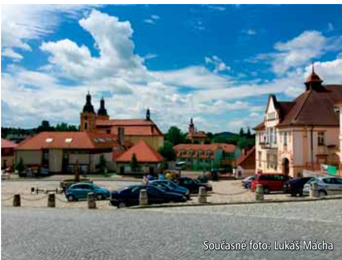
Současné foto: Lukáš Mácha