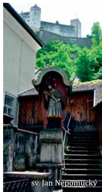
sv. Jan Nepomucký