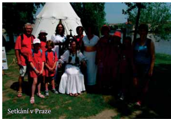
Setkání v Praze