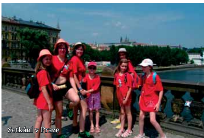
Setkání v Praze