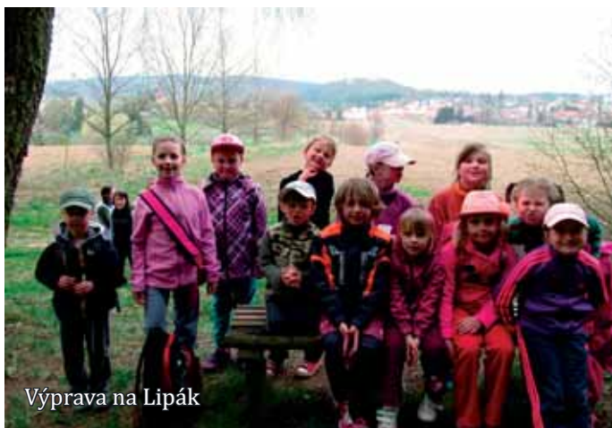
Výprava na Lipák