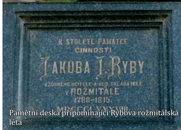
Pamětní deska připomínající Rybova rožmitálská léta