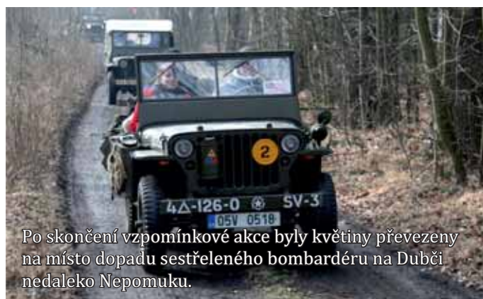
Po skončení vzpomínkové akce byly květiny převezeny na místo dopadu sestřeleného bombardéru na Dubčiči nedaleko Nepomuku.