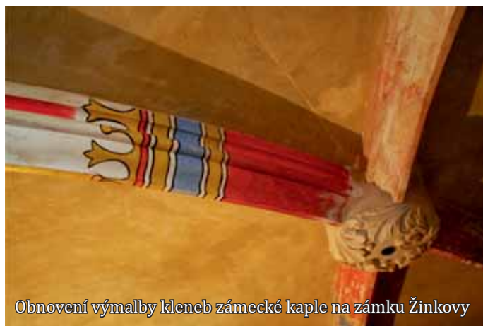
Obnovení výmalby kleneb zámecké kaple na zámku Žinkovy