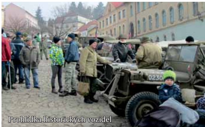
Prohlídka historických vozidel

Přítomní položili květiny k pamětní desce umístěné na budově radnice.