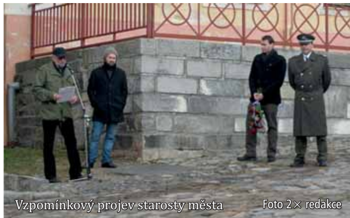
Vzpomínkový projev starosty města