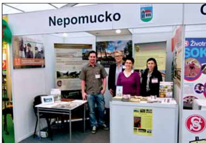
Společná prezentace města Nepomuk, Zámku Žinkovy a Mikroregionu Nepomucko na veletrhu Holiday World v Praze (19. - 22. 2. 2015).