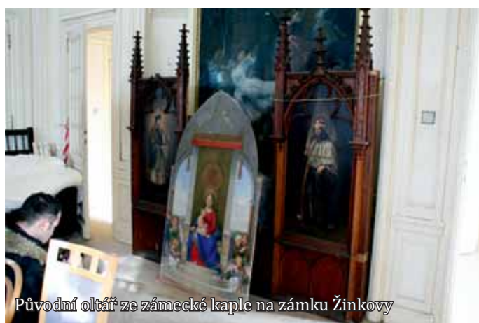
Původní oltář ze zámecké kaple na zámku Žinkovy