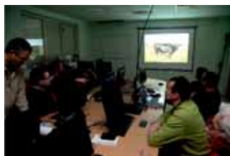
Počítačová učebna ve FÉNIXU