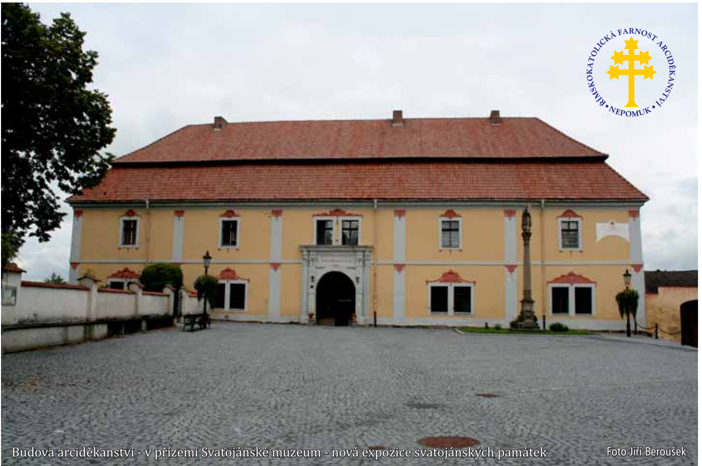
Budova arciděkanství - v přízemí Svatojánské muzeum - nová expozice svatojánských památek