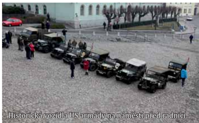
Historická vozidla US armády na náměstí před radnicí