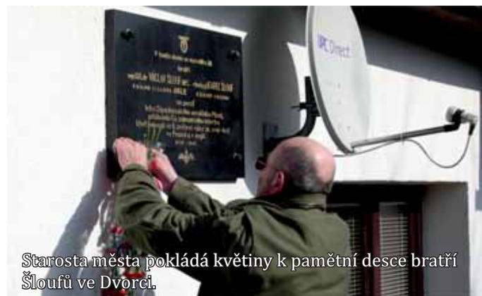
Starosta města pokládá květiny k pamětní desce bratří Šloufů ve Dvůrci.