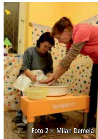
V ateliéru najdete i hrncířské kruhy