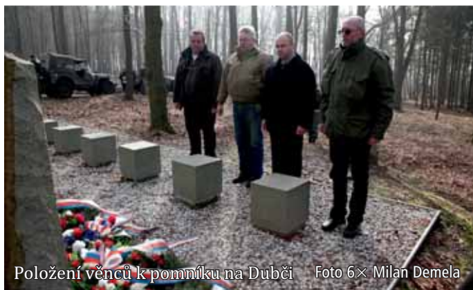
Položení věnců k pomníku na Dubčiči