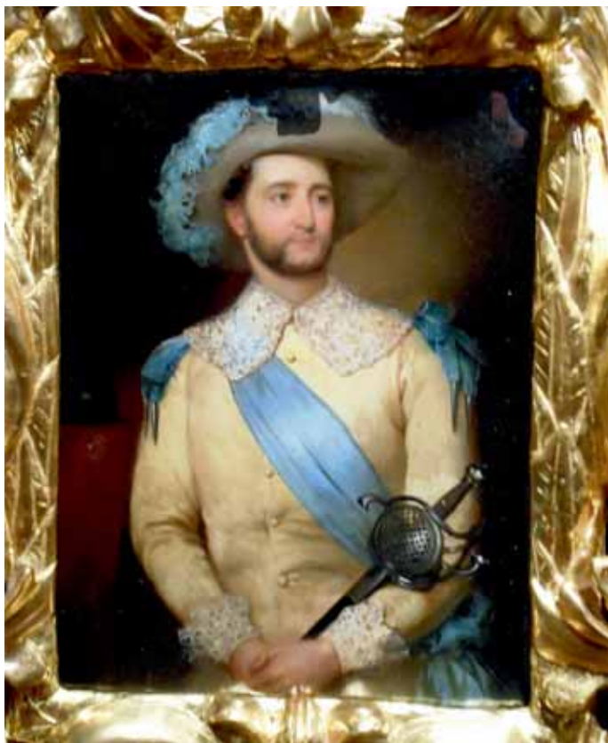
Karel Vincenc z Auerspergu v mládí