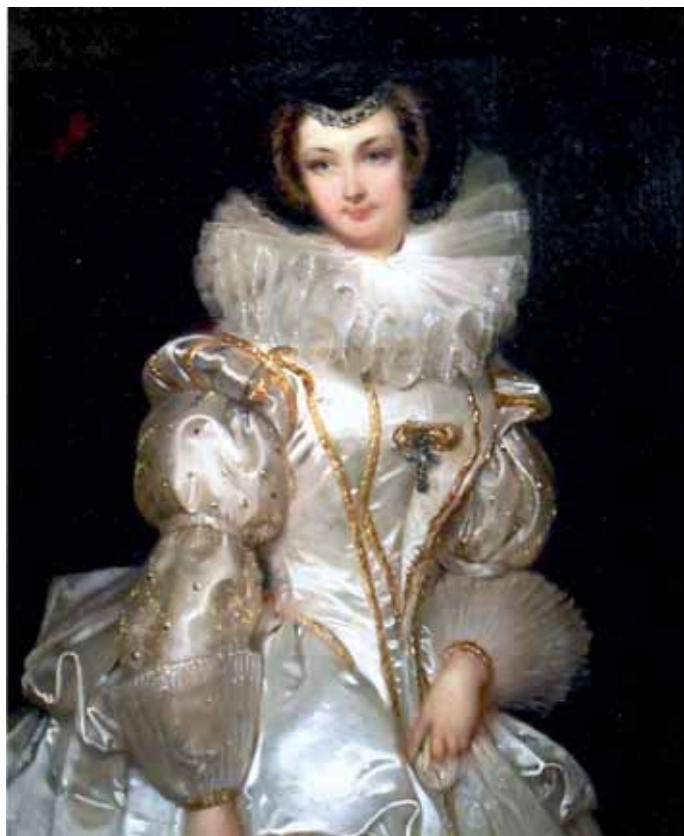
Vilemína z Auerspergu