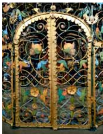
Detail mříže ke kašně z Jindřichova Hradce