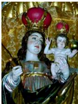
17. – 18. století