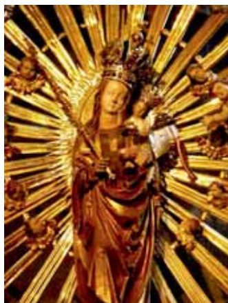
14. – 15. století