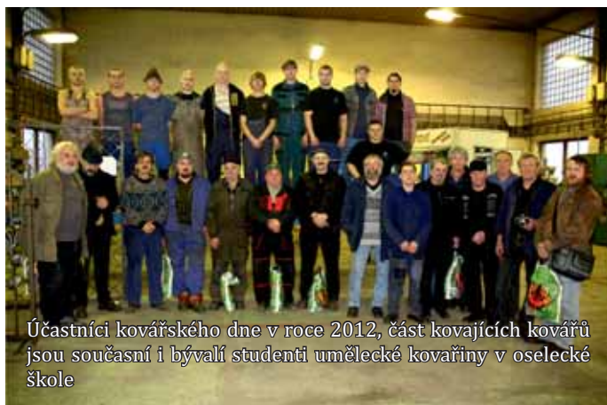
Účastníci kovářského dne v roce 2012, část kovajících kovářů jsou současní i bývalí studenti umělecké kovařiny v oselecké škole