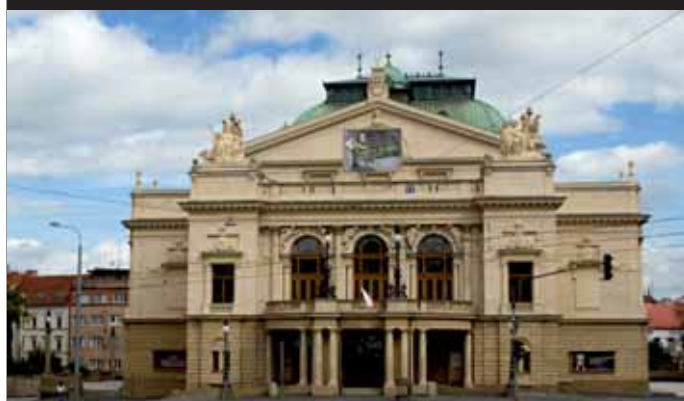
Divadlo J.K.Tyla Plzeň