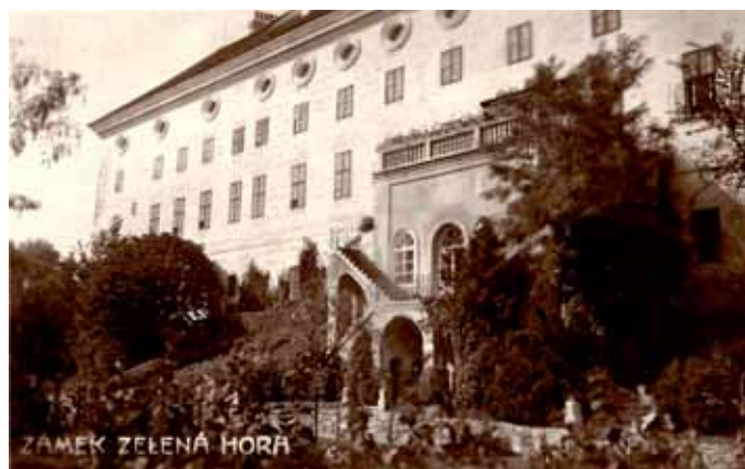
Sala terrena kol. r. 1910