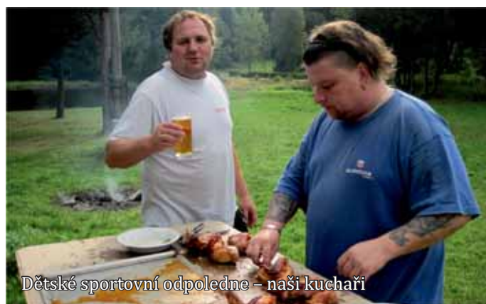
Dětské sportovní odpoledne – naši kuchaři