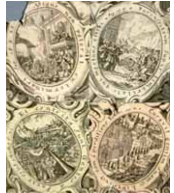
Příběh sochy na rytině z 2. pol. 17. století