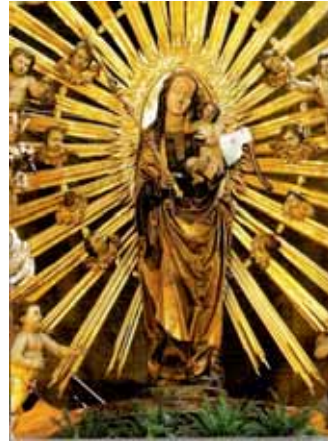
Originál Panny Marie Zelenohorské se sekerou