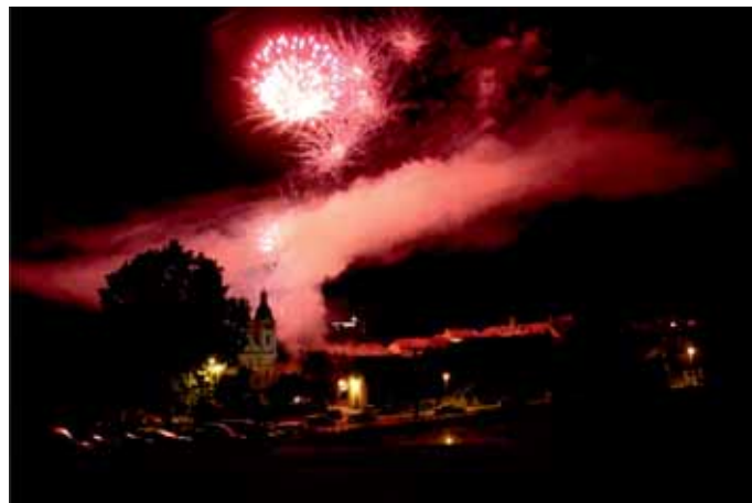
Zelená Hora v záři reflektorů a ohňostroje 22. 6. 2014 po půlnoci.