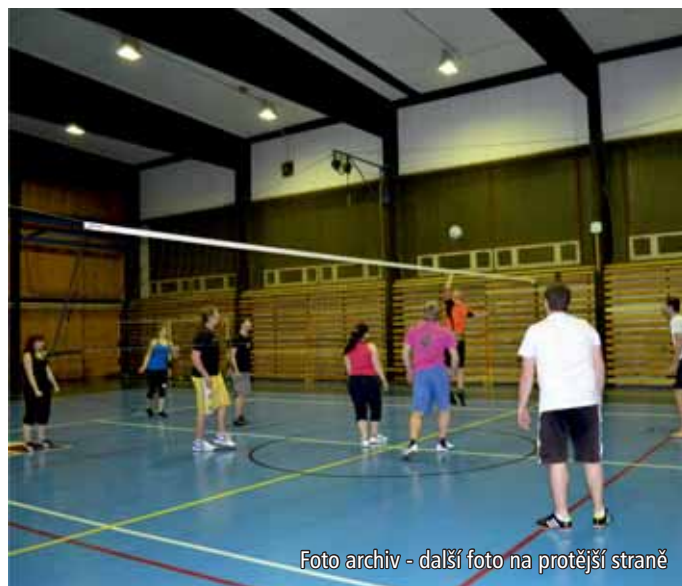
další foto na protější straně