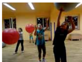
Rozcvička s míči na kurzu Atletiky