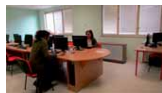
Nová počítačová učebna