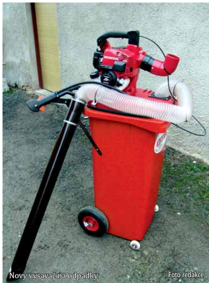
Nový vysavač na odpadky