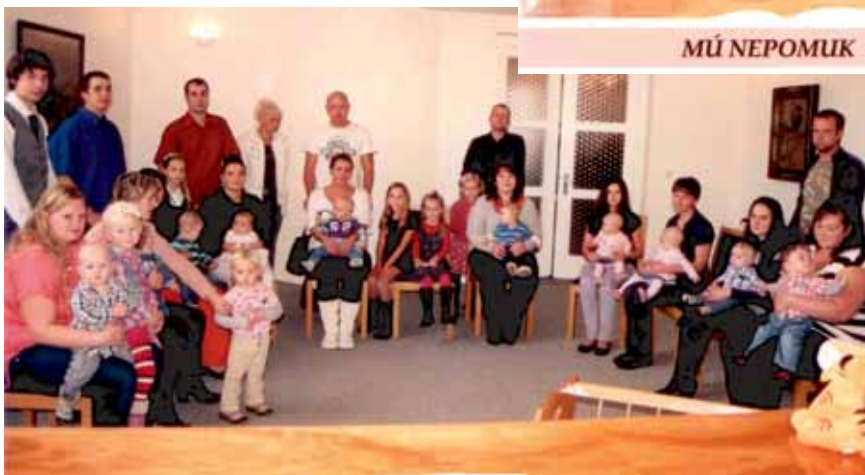
MŮ NEPOMUK - VÍTÁNÍ OBCÁNKŮ - 26.10.2013