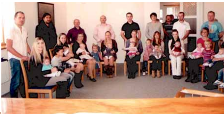
MŮ NEPOMUK - VÍTÁNÍ OBCÁNKŮ - 26.10.2013