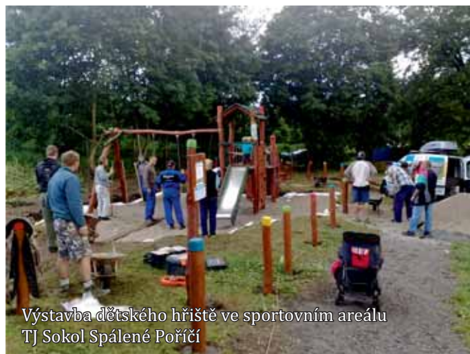
Výstavba dětského hřiště ve sportovním areálu TJ Sokol Spálené Poříčí

http://www.mas.nepomucko.cz/subdom/mas/cs/rozvojovy-plan-2014-2020