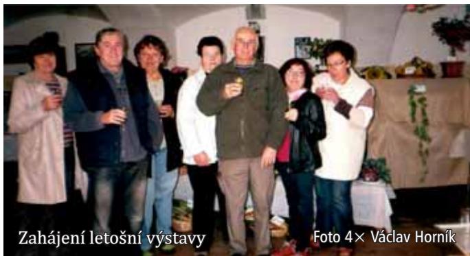
Zahájení letošní výstavy