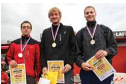
2. kategorie 19-35 let muži 2. Tříška, 1. Brož, 3. Kotrbatý