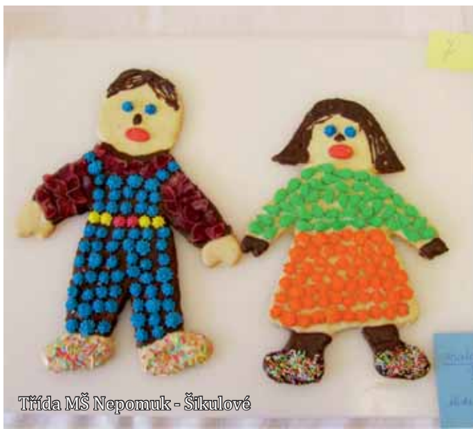
Třída MŠ Nepomuk - Šíkulové