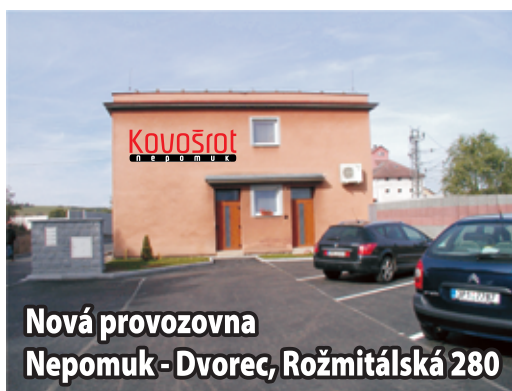
Nová provozovna Nepomuk - Dvorec, Rožmitálská 280

VÝKUP ŠROTU A BAREVNÝCH KOVŮ EKOLOGICKÁ LIKVIDACE AUTOVRAKŮ PRODEJ NÁHRADNÍCH DÍLŮ