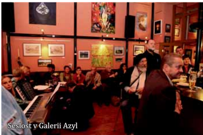
Seslost v Galerii Azyl