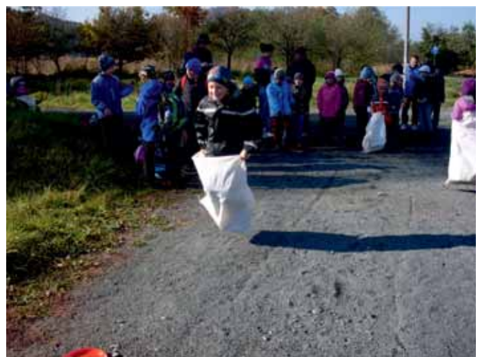
Děti a vychovatelky školní družiny ze ZŠ a MŠ Chotíkov