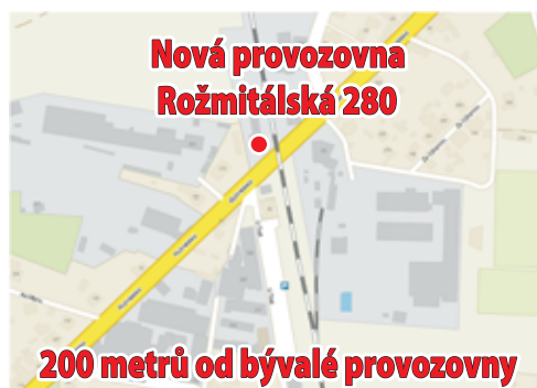
Nová provozovna Rožmitálská 280