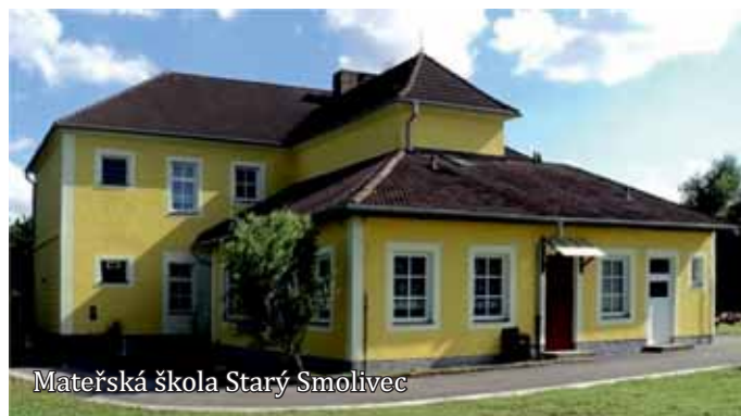
Mateřská škola Starý Smolivec