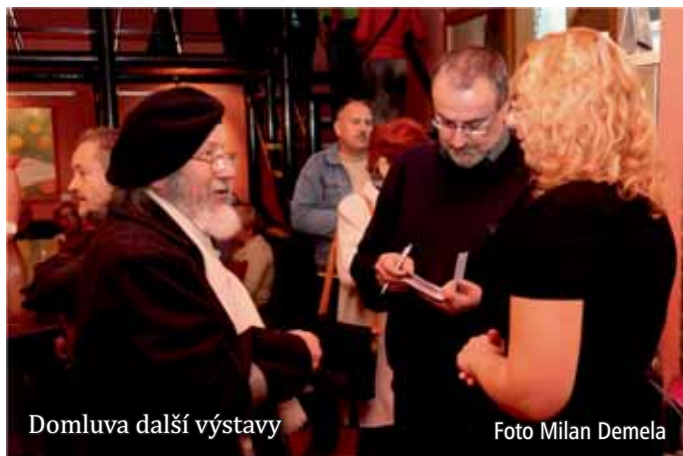
Domluva další výstavy