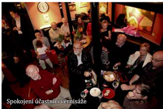
Spokojení účastníci vernisáže