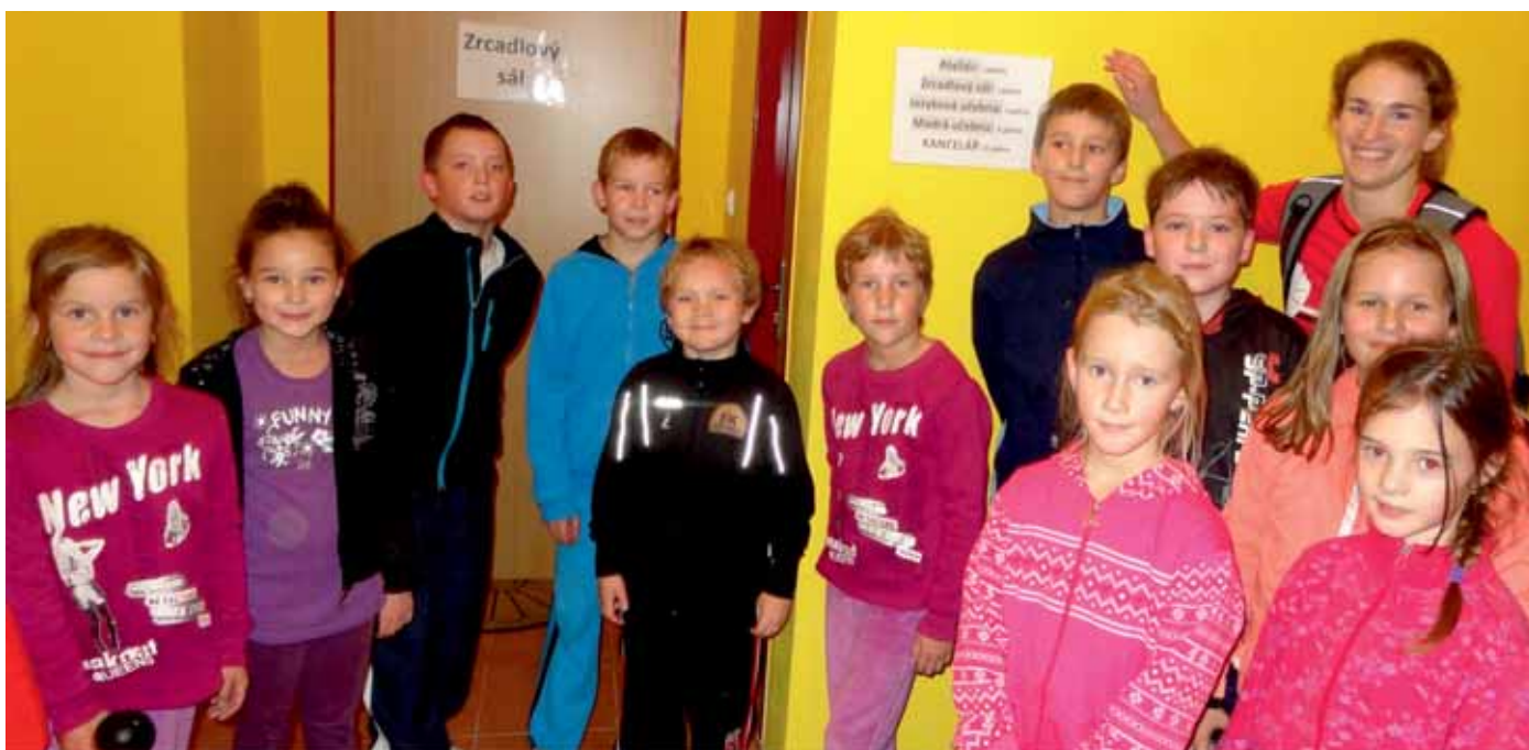
Kroužek přípravy na atletiku po návratu z prvního tréninku