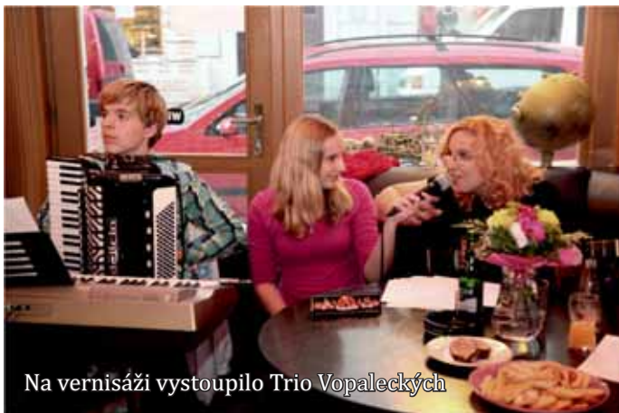
Na vernisáži vystoupilo Trio Vopaleckých