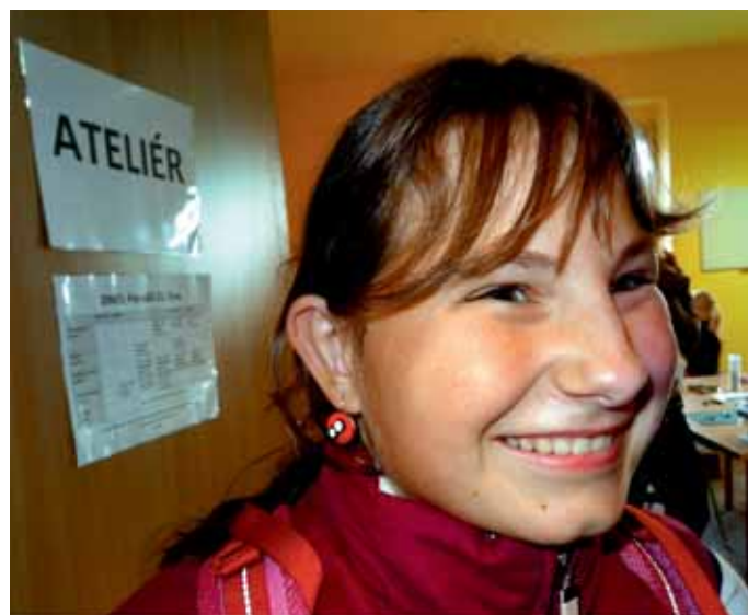
Fénix najdete 50 m nad Kulturním informačním centrem, Radost z FIMO náušnic – výrobek z prvního dne kurzu na náměstí v Nepomuku