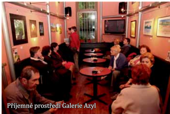
Příjemné prostředí Galerie Azyl