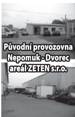
Původní provozovna Nepomuk - Dvorec areál ZETEN s.r.o.