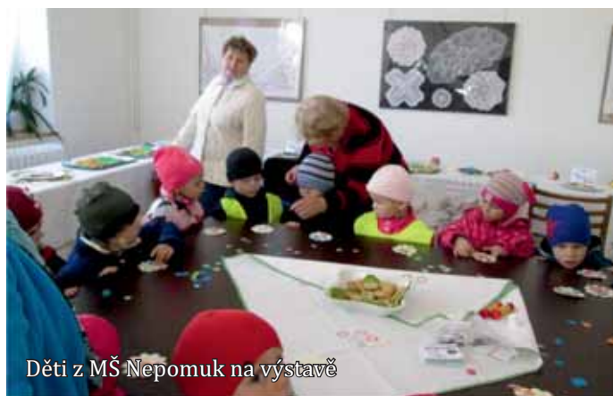
Děti z MŠ Nepomuk na výstavě