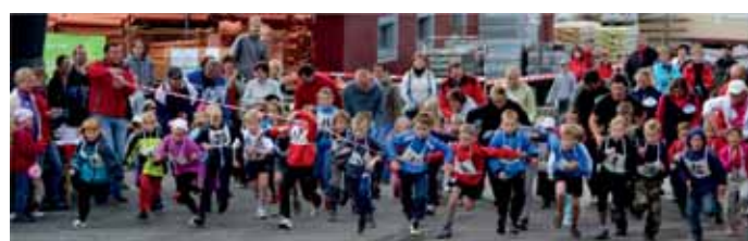
Start nejmenší dětské kategorie