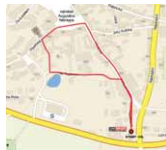
Děti - trasa 1000 m běh 2013