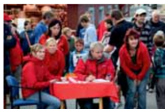
Kdo bude letos první?