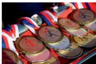
Sada medailí vzor 2012