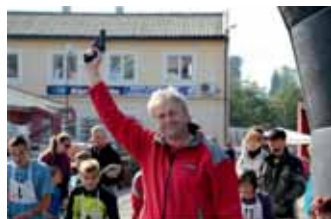
Tři, dva, jedna... START!