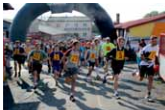
Dospělí vyráží na 5 km trať