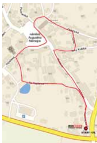
Junioři - trasa 1550 m běh 2013