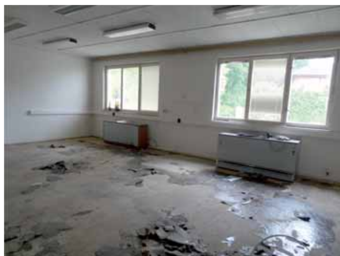
Budoucí počítačová učebna