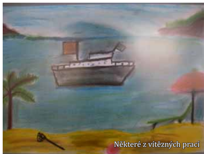
Některé z vítězných prací

Začátkem července se Evropská unie rozrostla o nový členský stát Chorvatsko. Kdo v posledních dvou červnových týdnech zavítal do nepomucké městské galerie, mohl si prohlédnout, jak nový členský stát ztvárnili nejzdatnější žáci základních škol na Nepomucku. Návštěvníci navíc také rozhodli svým hlasováním o konečném vítězi.