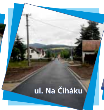
ul. Na Čiháku