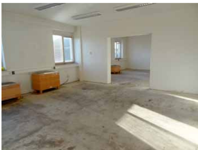
Budoucí zrcadlový sál