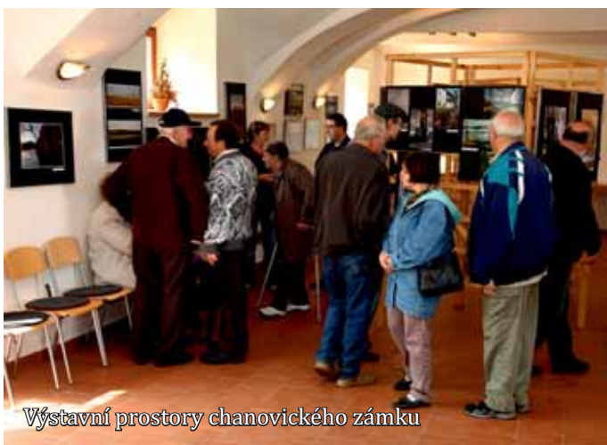
Výstavní prostory chanovického zámku