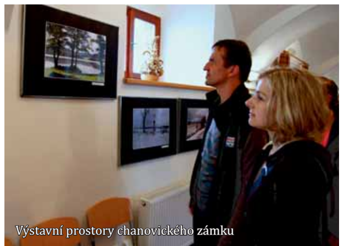
Výstavní prostory chanovického zámku