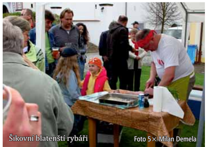
Šikovní blatenští rybáři