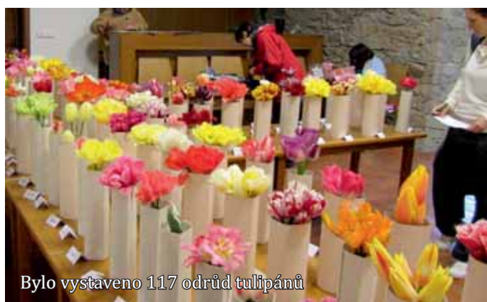
Bylo vystaveno 117 odrůd tulipánů