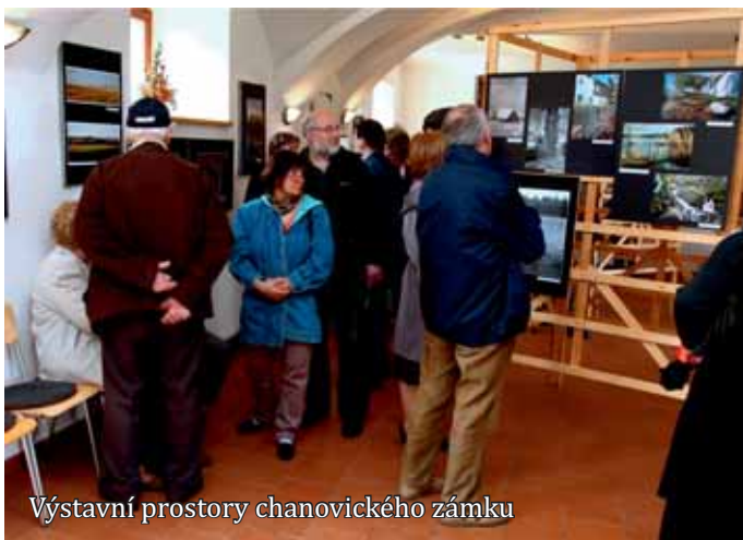
Výstavní prostory chanovického zámku