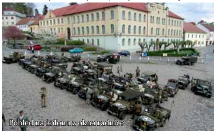
Pohled na kolonu z okna radnice

Příjezd kolony historických vojenských vozidel u příležitosti 68. výročí ukončení druhé světové války, 5. května 2013