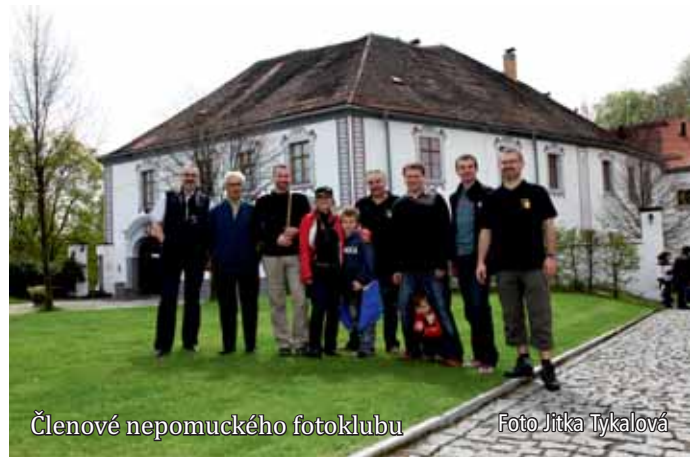
Členové nepomuckého fotoklubu