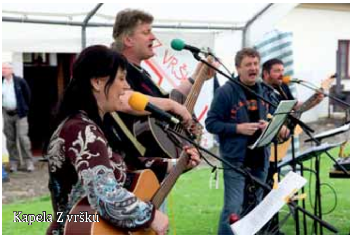
Kapela Z vršku