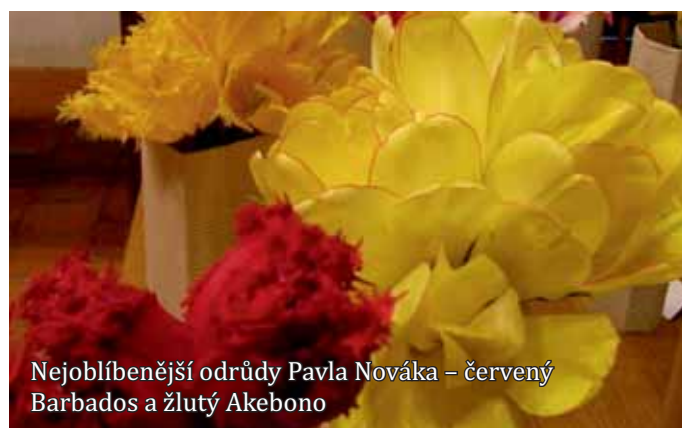
Nejoblíbenější odrůdy Pavla Nováka – červený Barbados a žlutý Akebono