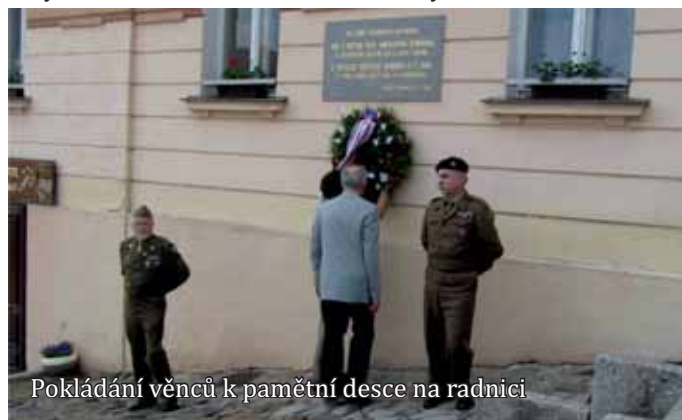
Pokládání věnců k pamětní desce na radnici