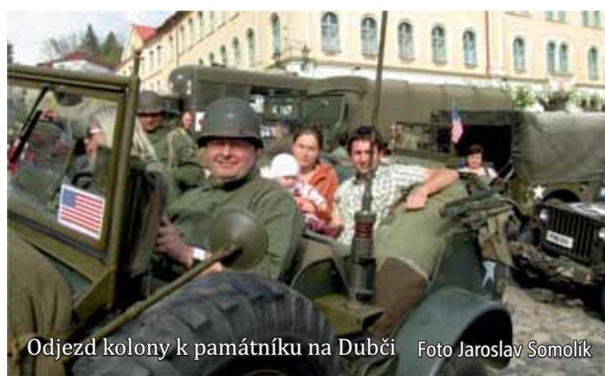
Odjezd kolony k památníku na Dubči