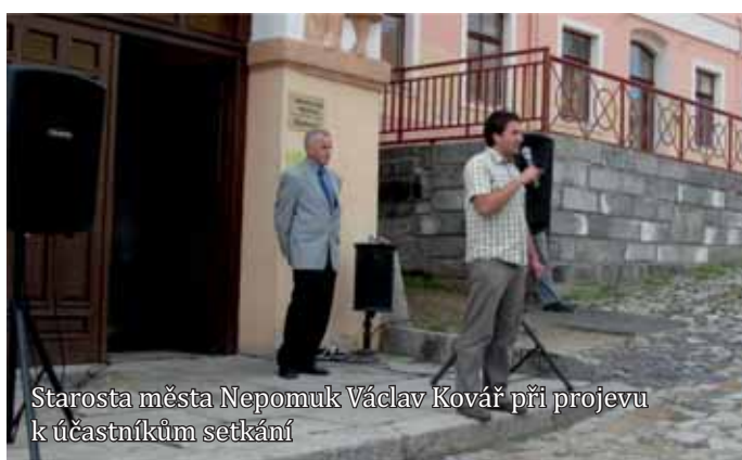
Starosta města Nepomuk Václav Kovář při projevu k účastníkům setkání