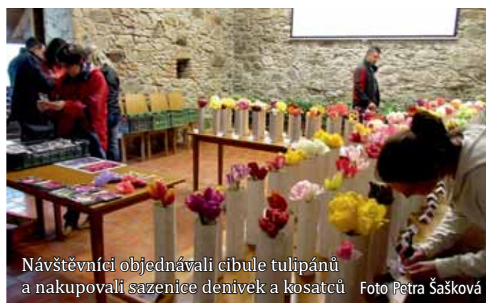
Návštěvníci objednávali cibule tulipánů a nakupovali sazenice denívek a kosatců