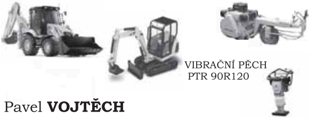
VIBRAČNÍ PĚCH PTR 90R120

JCB 3CX, CATERPILLAR CAT 303 CR VÁLEC Stavstroj WV 3405