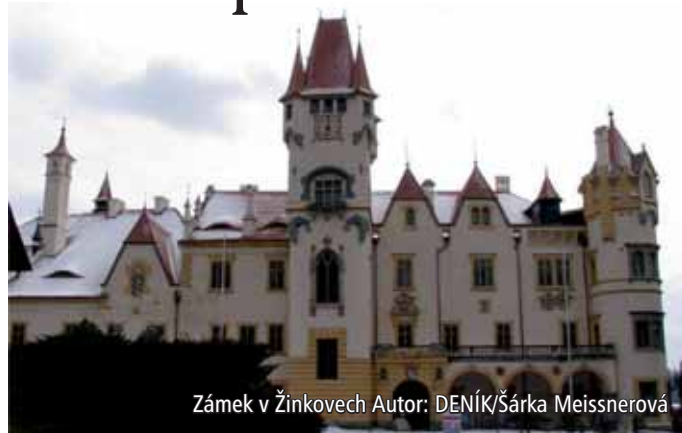
Zámek v Žinkovech