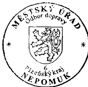
otisk úředního razítka

Proti tomuto rozhodnutí se mohou účastníci řízení odvolat do 15 dnů u zdejšího Městského úřadu ode dne jeho oznámení; prvním dnem lhůty je den následující po dni oznámení rozhodnutí. Odvolání bude postoupeno Krajskému úřadu Západočeského kraje k rozhodnutí.